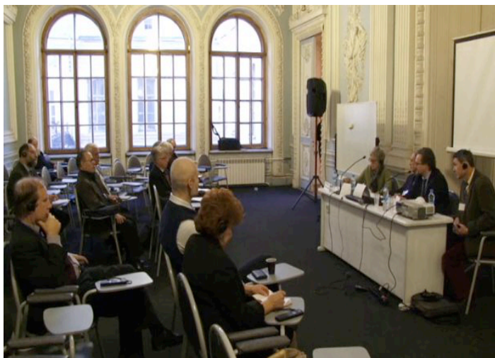
Colloque de St Petersburg