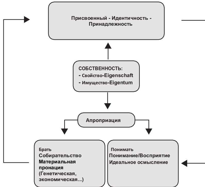
Схема 1 Собственность и апроприация